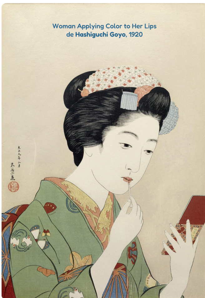
Woman Applying Color to Her Lips de Hashiguchi Goyo, 1920

Cada pessoa tem um jeitinho único, e isso é o que deixa o mundo tão bonito.